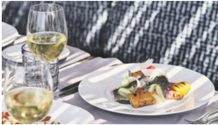
Tavernan Pelagos serverar "cypriotiskt överflöd". Foto: Pressbild

Naturligt välmående i grottan Afrodites bad. Foto: Pressbild