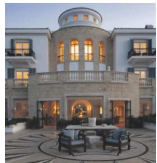
Hotellet Anassas spa har utnämnts till ett av världens 15 bästa.