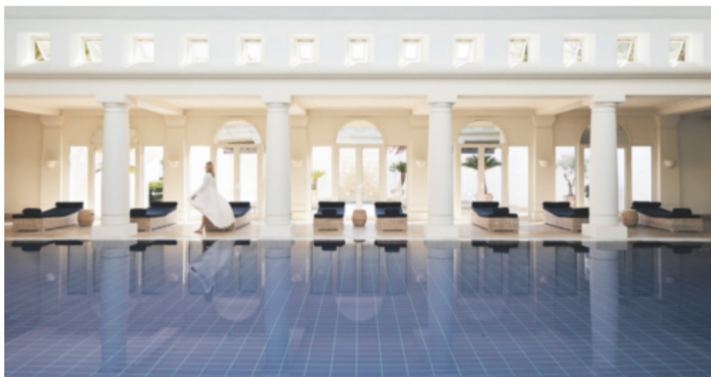
Historiska spatraditioner på Thalassa. Foto: Pressbild

Kanjonen Avakas lockar många vandrare (t h). Foto: Pressbild